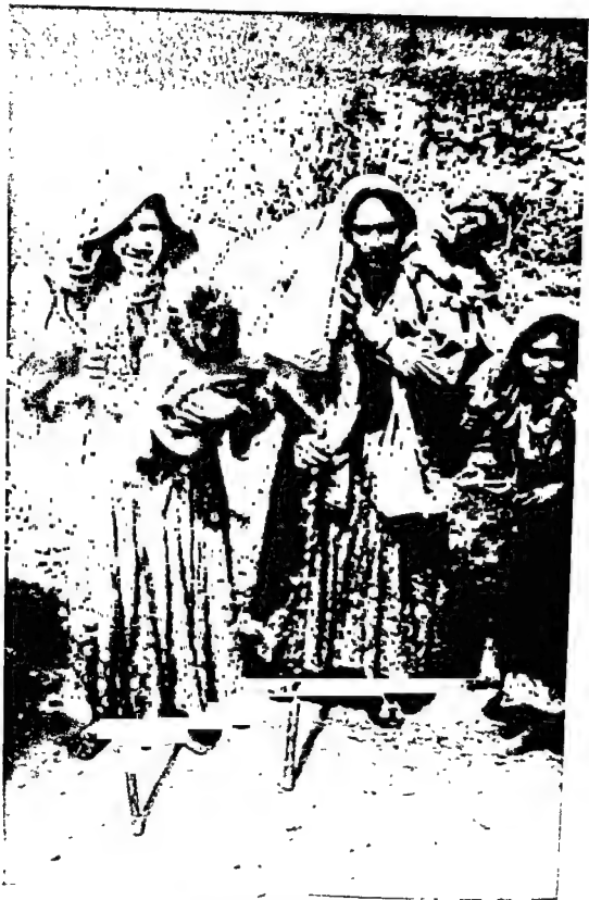
सड़ी चढ़ाई पार करती हुई गविरनें